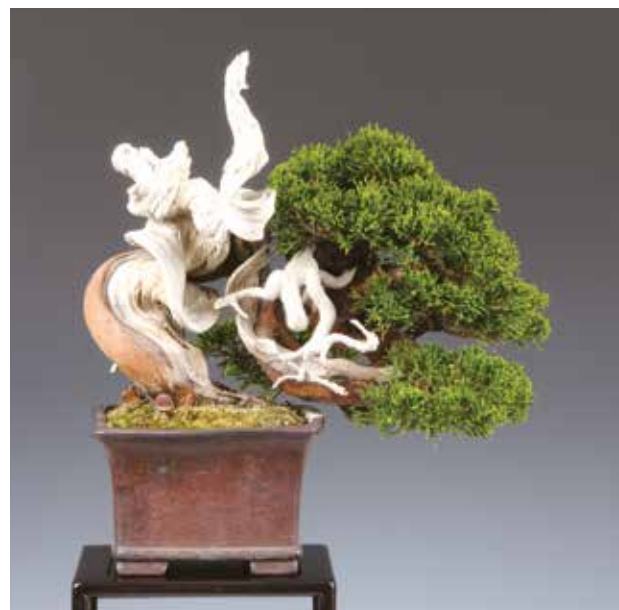
14. Juniperus chinensis , altezza 19 cm. Si stima che questo esemplare possa avere circa 150 anni. È una pianta nata in natura lavorata a shohin, in vaso da circa 15 anni. Sorprendente è lo shari piatto che si eleva diritto verso l'alto.