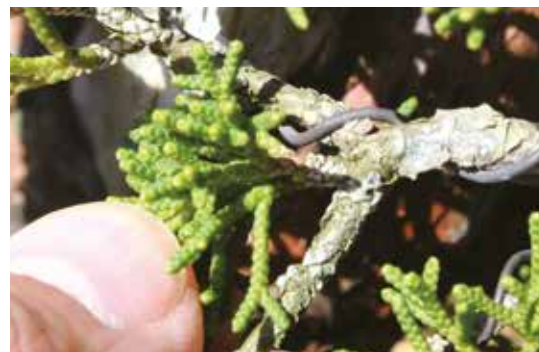
17. Per mantenere le dimensioni di un bonsai shohin di Juniperus chinensis , è necessario occuparsi delle gemme interne, affinché quelle spuntate sulla biforcazione dei rami si sviluppino; se invece l'obiettivo è che la pianta si ingrossi, si agirà al contrario.