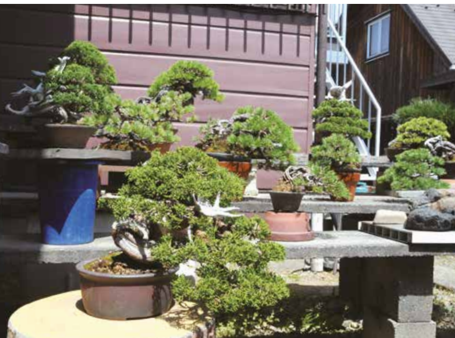
15. Gli esemplari di Juniperus chinensis di Nakamura: su alcuni di questi verrà applicato il lavoro di perfezionamento.